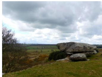
Le spot photo et repos

Arrivez au vous du champ, passer la barrière toujours en fermant bien derrière vous. Vous devriez avoir une petite maison à gauche et un pré sur la droite.