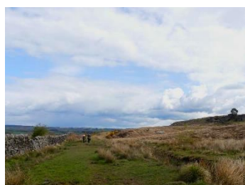
Le chemin qui longe le muret avant d'arriver à la maison (vue dans l'autre sens)

Continuez de longer tranquillement le muret, vous devriez arriver à une maison à un moment. Sur la gauche, vous pouvez voir le relief du grand crag et vous apercevrez peut-être des personnes qui font de l'escalade. Juste après la maison, un chemin part vers la gauche, c'est celui-ci qu'il faut suivre. Après une dizaine de mètres, vous pouvez continuer sur le chemin principal ou aller sur la gauche pour monter au sommet du relief. Il y a une très belle vue dégagée sur la campagne environnante. Si vous allez par ici, après votre petit détour, retournez sur le chemin principal.