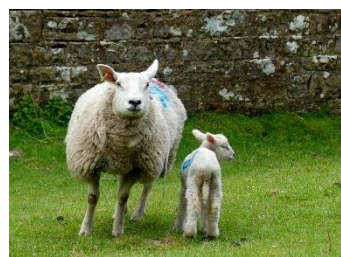
Fin avril est la saison des agneaux !