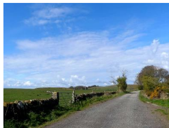
Le chemin vers le parking, après le hameau.

Attention, le parking n'est pas surveillé et « à vos risques et périls ». On peut apercevoir le parking sur la dernière photo de l'article. Attention, la route est cahoteuse, si vous avez une voiture très basse, je ne vous conseil pas de l'emprunter. Il y a sûrement d'autres options plus au sud mais je ne les ai pas encore essayés.