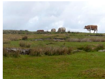
Les vaches, reines du pré