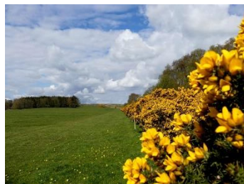
Le début du chein avec les ajoncs

Allez directement vers le relief rocheux, vous êtes arrivé à un premier (petit) crag ! Vous pouvez passer au milieu puis prendre la hauteur à la fin pour avoir une meilleure vue du relief.