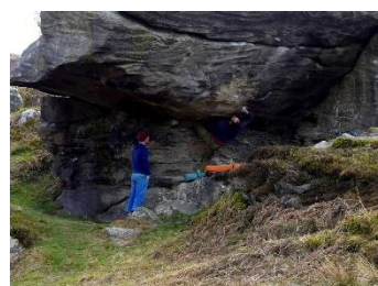
Deux grimpeurs qui s'entraînent