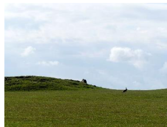
De grand près sur la gauche permettent de voir des lièvres.