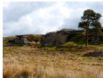
La sortie du passage qui descend vu du muret en face