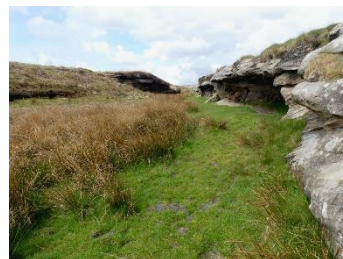
Le premier petit crag