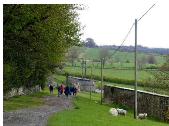
Le chemin après la barrière

La balade est finie, si vous avez encore de l'énergie à dépenser, n'hésitez pas à aller faire le tour du lac Bolam juste à côté 😊