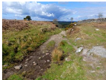
Le passage qui descend

Restez dans ce champ et suivez le muret qui va vers la gauche.