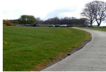
La route qui mène au parking