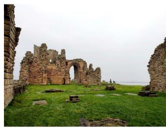
Nef de l'église