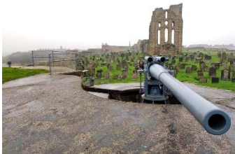
Canon face à la mer

A l'époque du monastère, un bâtiment faisait aussi office de phare afin de guider les bateaux. Un vrai phare fut construit en 1664 avec les pierres du prieuré. Ce dernier fut détruit en 1898 et fut remplacé l'actuel phare Sainte Mary un peu plus au nord. Le bâtiment le plus récent que vous pouvez voir au fond à gauche a été construit dans les années 80 et abritait les gardes côtes qui ont depuis déménager ailleurs.