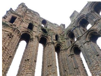
Chevet de l'église