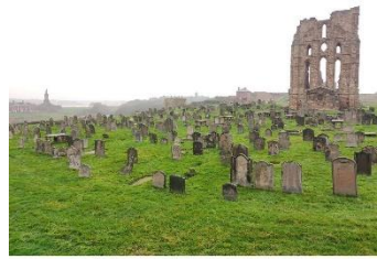
Le cimetière derrière l'église.