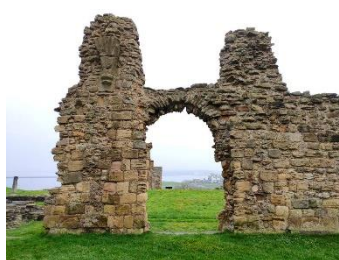
Ouverture dans l'église menant à la partie réservée aux moines