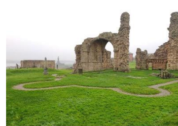
Tracé de l'ancienne église