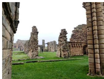
Intérieur de l'église