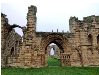
Façade de l'église

Au sein des murs, en plus de l'église et des quartiers des moines, on devait sûrement trouver une ferme, une étable, un verger, ... L'idée est d'avoir tout le nécessaire sur place afin de ne pas sortir du monastère et « de se disperser au dehors » (chapitre 66 des règles de St Benoît). Vous pourrez trouver des dessins de reconstitution à l'intérieur du site.