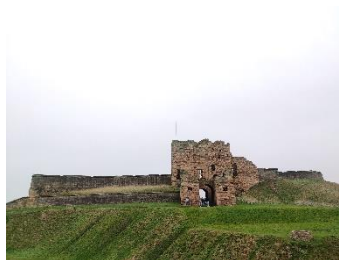
Entrée du prieuré

Northumberland : région de l'Angleterre, tout au nord, sous l'Écosse.