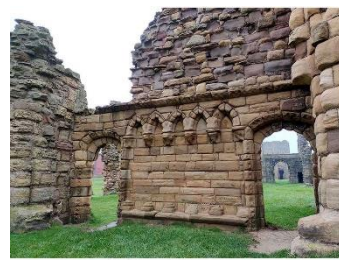
La clotûre vue de la partie réservée aux religieux