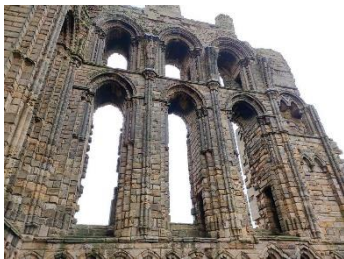
Les agrandissements réalisés grâce aux dons

Absidiole : L'abside c'est la partie arrondie qui ferme le chœur et donc représente le fond de l'église (le mur du fond étant le chevet), normalement orientée vers l'Est. On appelle absidioles les petits ajouts arrondis autour de l'abside sur le plan de l'église. Elles servent souvent de petites chapelles.