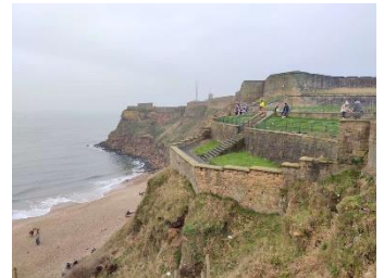
Murs de défense