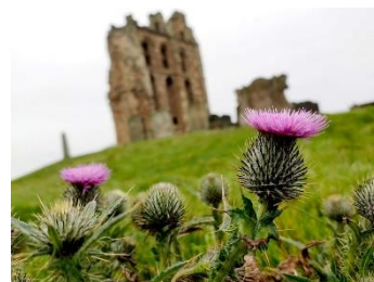
Fleur de chardon