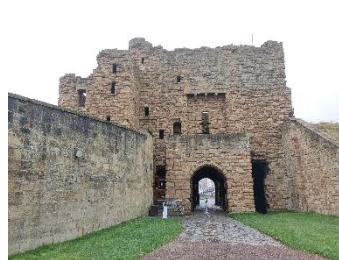
Vue arrière de l'entrée