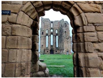
Vue du chevet à travers la clotûre

Et le couvent me diriez-vous ? Déjà, ils ne sont pas réservés qu'aux femmes comme on le croit souvent, oui messieurs, vous y avez aussi droit ! Il accueille des frères et sœurs et non pas des moines. La grange majorité dépendent des ordres mendiants (Les Franciscains, les Carmes, ...) et leurs membres sont en contact avec l'extérieur et offre leur aide. Ils vivent de la générosité des fidèles et sont souvent situés en ville.