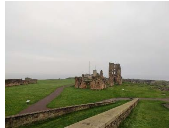
Vue sur l'ensemble du site