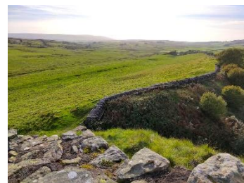
Vue après le fortin