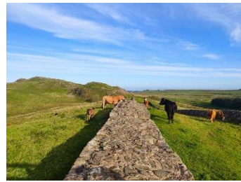
Reconstitution historique de la garde du mur par des vaches