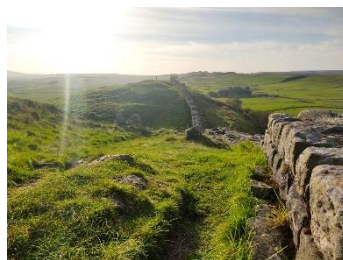
Vue après le fortin