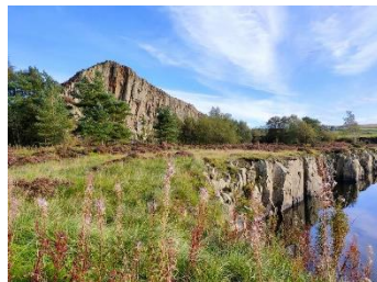
vue du parking

La grande cascade de High Force est d'ailleurs un affleurement de ce phénomène géologique et plusieurs châteaux ont profité du Whin Sill et ont été construit sur ses hauteurs.