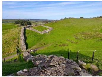
Fortin 'milecastle' 42

UNESCO : Organisation des Nations unies pour l'éducation, la science et la culture