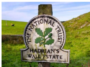
Plaque du National Trust

Une boucle de randonnée est possible au départ du parking. Rendez-vous sur le site du parc national du Northumberland pour la carte et les indications .